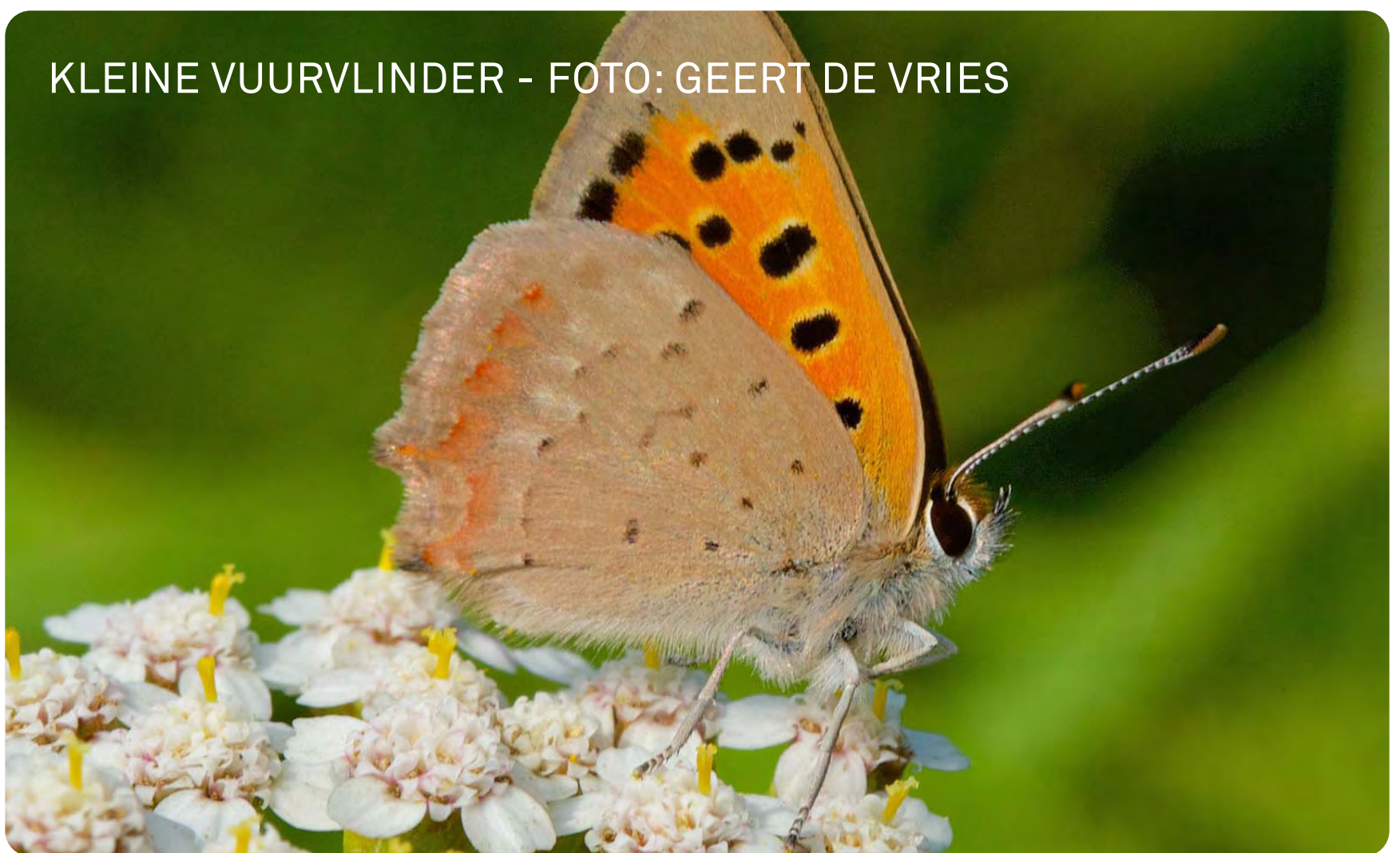
KLEINE VUURVLINDER

Vlinders en andere insecten die zich ooit prima thuis voelden op het ouderwetse boerenland, slaagden erin hier succesvol te overleven. Zo vind je op de schrale graslandjes bijzondere dagvlinders als het oranje zandoogje, het hooibeestje, de kleine en de bruine vuurvlinder, omdat hier de planten groeien die graag door rupsen worden gegeten, en de bloemen waar de vinders hun nectar kunnen halen. Door het gras jaarlijks aan het begin van de zomer te maaien en het maaisel af te voeren probeert Het Drentse Landschap de planten waar het vlinders het