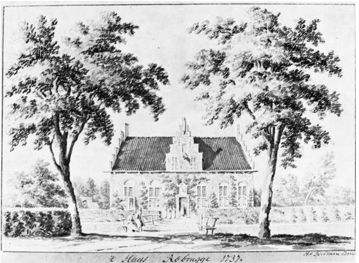
Huis Rheebrugge 1737.

Huis Rheebruggen in 1620 (tekening Hendrik Spilman)